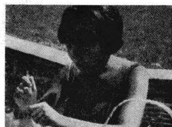
NORMAL: Person i brystbilledstørrelse kræver som regel kun en optagelsestid på 6-8 sek.