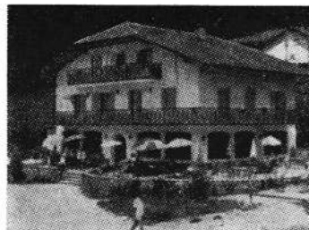
TOTAL: Afstandsoptagelse af stedet hvor handlingen udspilles. Optagelsestid 10-12 sek.