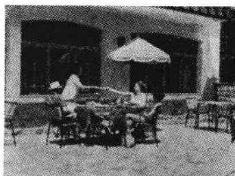
HALVTOTAL: Personerne i hel legemsstørrelse, kun lidt af omgivelserne er med. Opt. 8-10 sek.