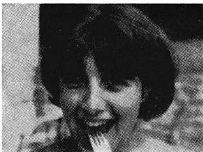
NÆROPTAGELSE: Scene taget på kort afstand (ca. 1 meter) eller med tele. Opt. 2-5 sek.